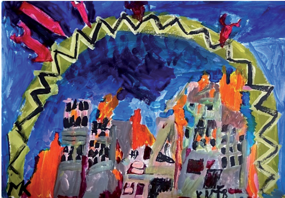
2. Zamknięte niebo nad Ukrainą, źródło: N. Pavlyuk 2. Закрите небо над Україною, джерело: Н. Павлюк 2. Closed sky above Ukraine, source: N. Pavlyuk