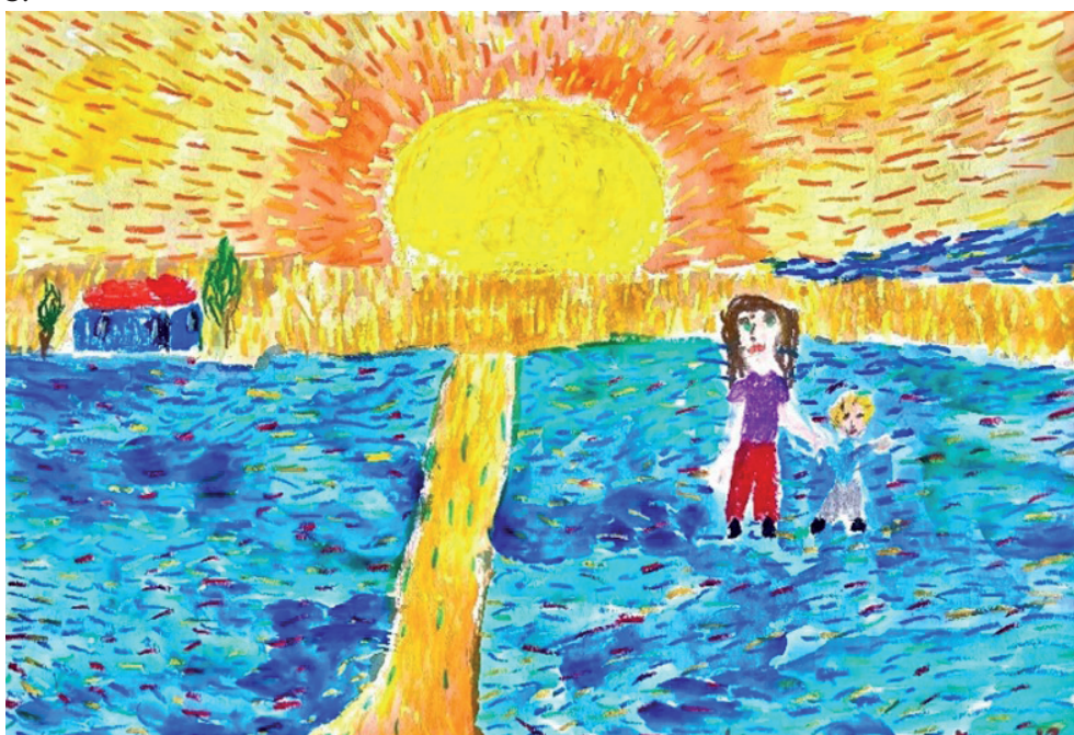
3. Otwarte niebo i światło słoneczne nad Ukrainą 3. Відкрите небо і сонячний світ над Україною 3. Open sky and sunshine over Ukraine