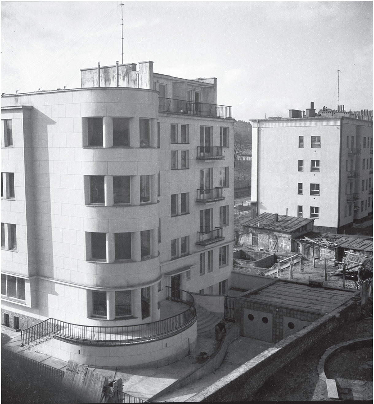
Ilustracja 14. Warszawa, ul. Belwederska 40/42 — budynek wielomieszkaniowy Bergmana. Widok od strony obecnej ul. Łądowej. Widoczne podwórze z garażami, a w głębi plac budowy nowej części budynku na parceli przy ul. Belwederskiej 42. Stan w marcu 1939 roku. Proj.: ul. Belwederska 40 — Remigiusz Ostoja-Chodkowski (1937); ul. Belwederska 42 — Henryk Douglas (1938). Fot. Szymon Syrkus [?]. Zbiory Naukowe ZAP WAPW, Fototeka, b.s.

Figure 14. Bergman multi-dwelling residential building, No. 40/42 Belwederska St., Warsaw. View from the present Łądowa St. Yard with garages visible as well as the building site of a new part of the building located on the No. 42 Belwederska St. lot. State in March, 1939. No. 40 Belwederska St. design by Remigiusz Ostoja-Chodkowski (1937); No. 42 Belwederska St. design by Henryk Douglas (1938). Photograph by Szymon Syrkus [?]. ZAP WAPW Scientific Collections, Fototeka, n.p.