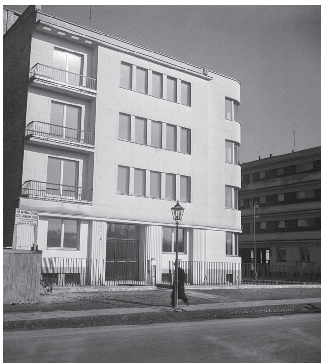
II. 11 A

Ilustracja 11. Warszawa, ul. Belwederska 40 — budynek wielomieszkaniowy Bergmana. Stan w marcu 1939 roku. Proj. Remigiusz Ostoja-Chodkowski (1937). Fot. Szymon Syrkus [?]. Zbiory Naukowe ZAP WAPW, Fototeka, b.s.: A — elewacja od strony ul. Belwederskiej; B — narożnik budynku u zbiegu ul. Belwederskiej i obecnej ul. Łądowej