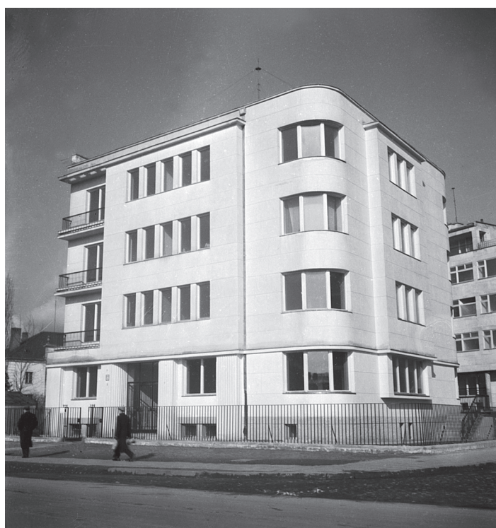
II. 11 B

Ilustracja 11. Warszawa, ul. Belwederska 40 — budynek wielomieszkaniowy Bergmana. Stan w marcu 1939 roku. Proj. Remigiusz Ostoja-Chodkowski (1937). A — elewacja od strony ul. Belwederskiej; B — narożnik budynku u zbiegu ul. Belwederskiej i obecnej ul. Łądowej