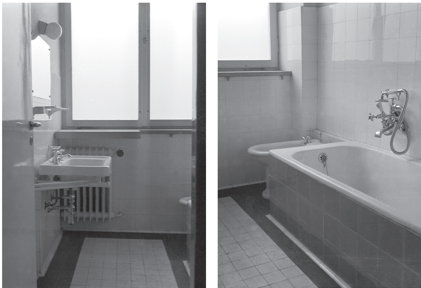
Ilustracja 6. Warszawa, ul. Złota 71 — kamienica czynszowa Zagajskich i Taumanów. Wnętrze łazienki. Stan z 1938 roku. Proj. H. i S. Syrkusowie (1938).

Figures 6. Zagajski and Tauman tenement house, No. 71 Złota St., Warsaw. Bathroom interior. State in 1938. Designed by H. and S. Syrkus (1938).