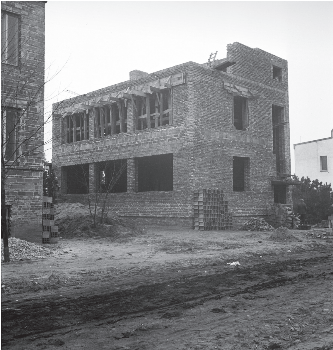
Ilustracja 1. Warszawa, ul. Barcicka 7 — dom Heymanów [?]. Widok domu w trakcie budowy od strony ul. Barcickiej. Stan ok. 1937 roku. Proj. H. i S. Syrkusowie (1935).

Figure 1. Heyman House [?], No. 7 Barcicka St., Warsaw. View of the building during construction as seen from Barcicka St. State ca. 1937. Designed by H. and S. Syrkus (1935).