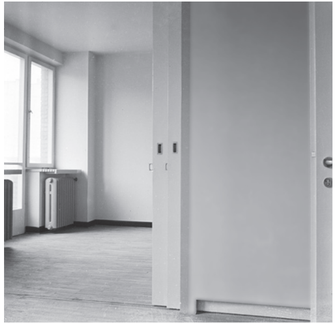
II. 2 Ilustracje 2, 3, 4, 5. Warszawa, ul. Złota 71 — kamienica czynszowa Zagajskich i Taumanów. Wnętrze jednego z jeszcze nie zasiedlonych mieszkań. Stan z 1938 roku. Proj. H. i S. Syrkusowie (1938). Fot. Szymon Syrkus [?]. Zbiory Naukowe ZAP WAPW, Fototeka, b.s.: 2 i 3 — widok na pokój z wyjściem na balkon; 4 — lekka ścianka działowa z drzwiami przesuwными, w głębi widoczne wyposażenie kuchni; 5 — widok na pokoje połączone rozsuwanymi i składanymi drzwiami, widoczny parkiet i ciemny lampas biegnący ponad listwami przypodłogowym II. 3

Figures 2, 3, 4, 5. Zagajski and Tauman tenement house, No. 71 Złota St., Warsaw. View of the interior of an apartment prior to occupation. State in 1938. Designed by H. and S. Syrkus (1938). Photograph by Szymon Syrkus [?]. ZAP WAPW Scientific Collections, Fototeka, n.p.: 2, 3 — view of a room with balcony access; 4 — lightweight partition wall with sliding doors, kitchen visible in the background; 5 — view of interconnected rooms with sliding and folding doors, visible parquet and dark trim above the baseboard